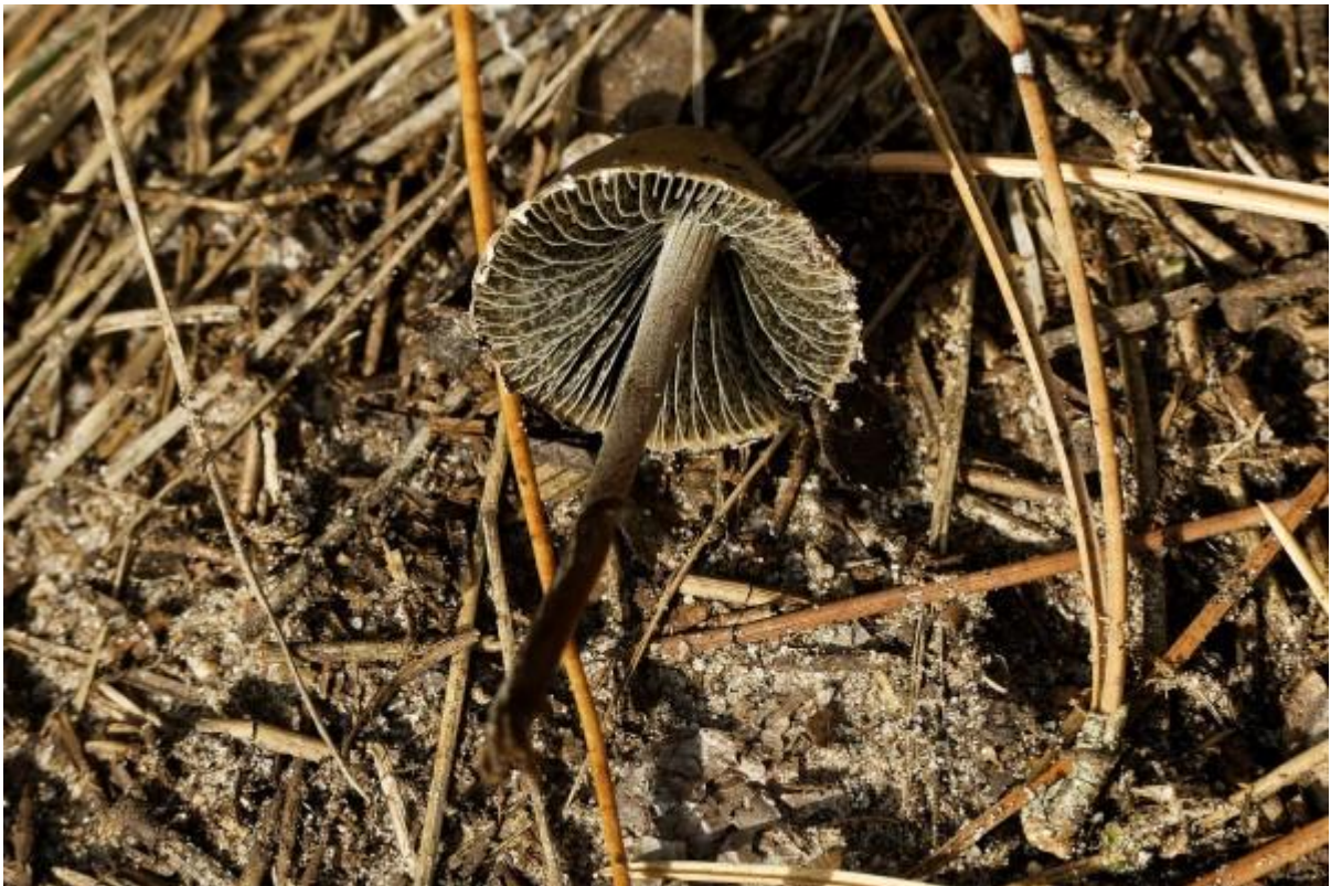
Of deze Franjevlekplaat