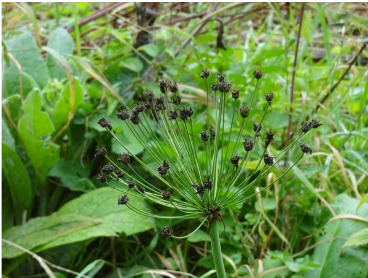
En de laatste sporen van de mooie Zwanenbloem