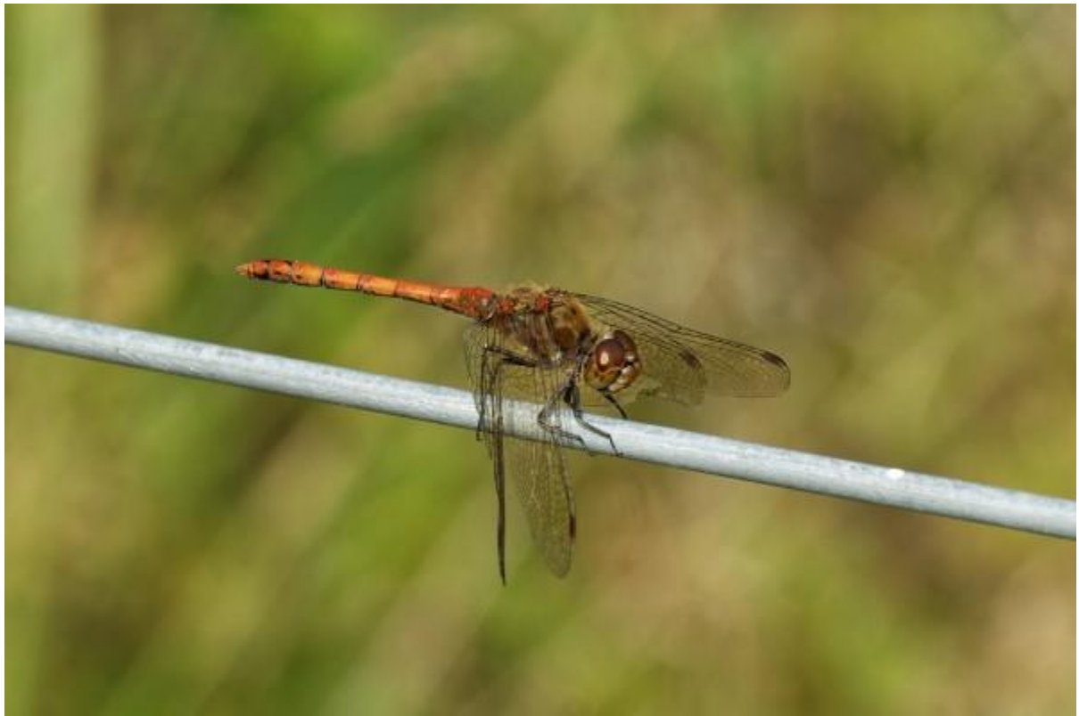
En deze Bruinrode heidelibel