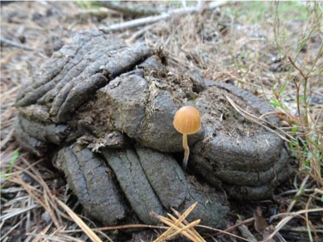
zoals dit Donzig breeksteeltje