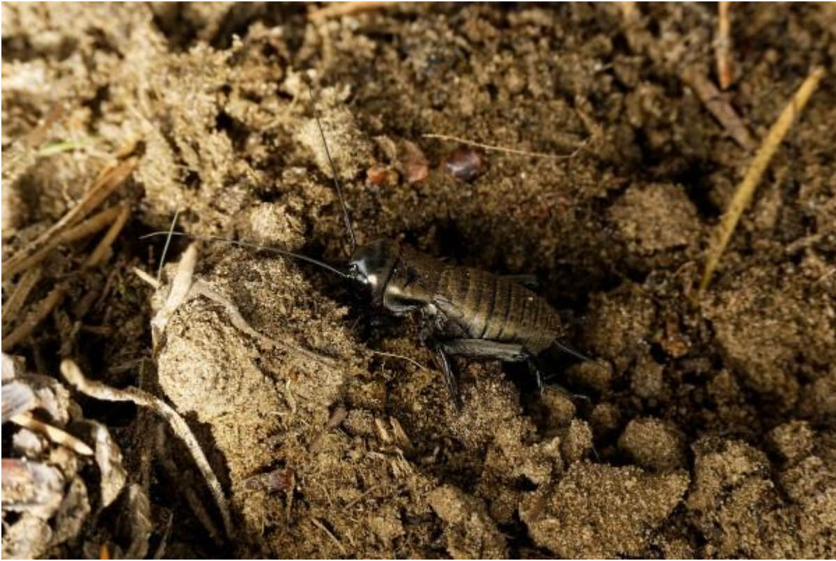
Een vlugge Veldkrekel