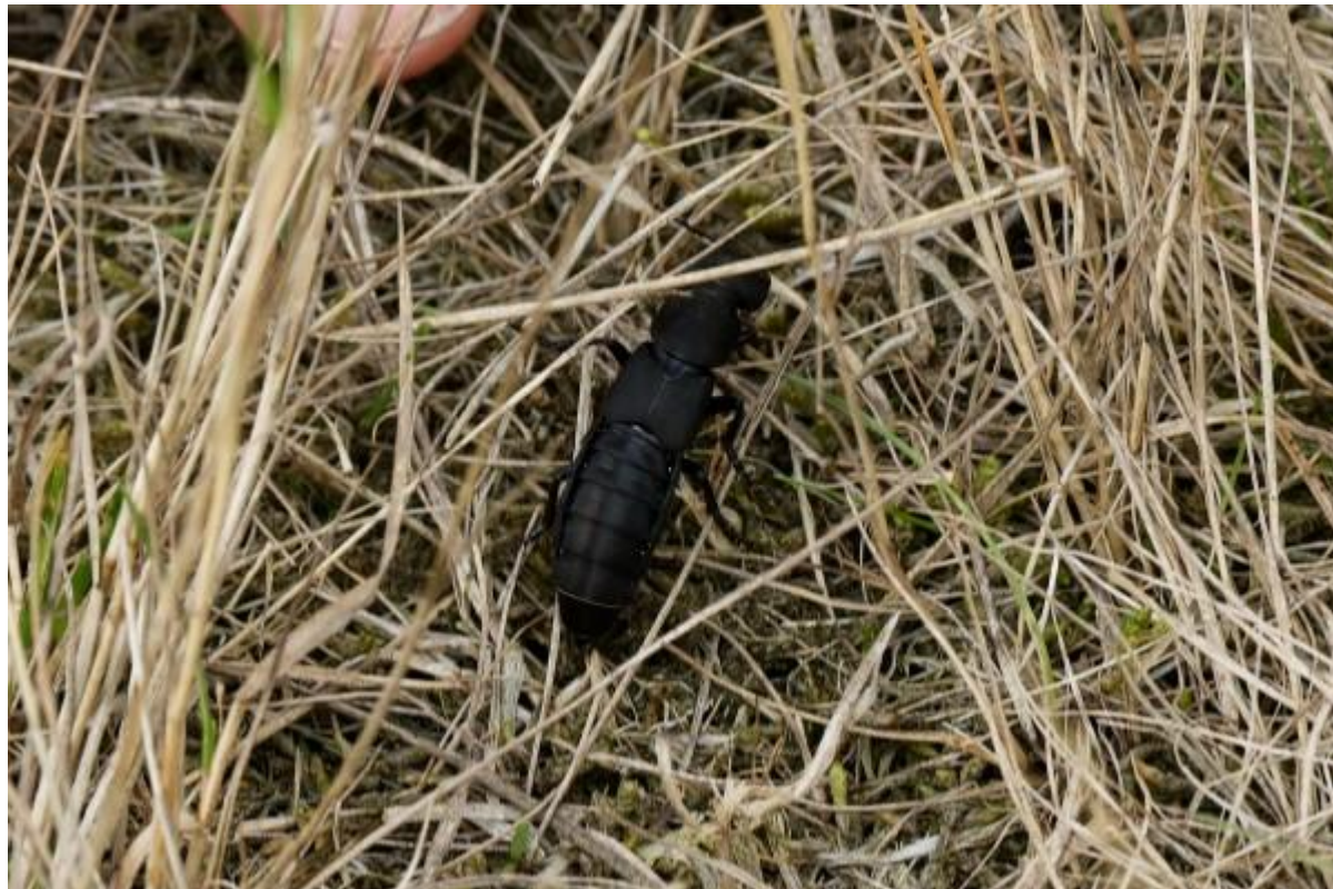
En beestjes zoals deze Stinkende kortschildkever